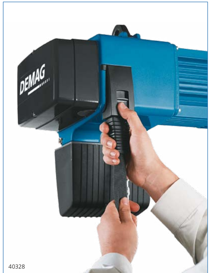
Höheneinstellung der Steuerleitung